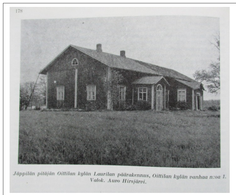
Oittilan kylän Laurilan talo (kuva Pieksämäen seudun historia -kirjasta)